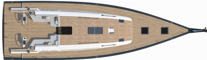
Versione 3 cabine 2 locali bagno: