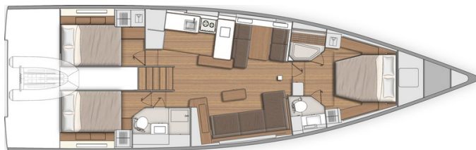
Versione 3 cabine 3 locali bagno - Cabina skipper: