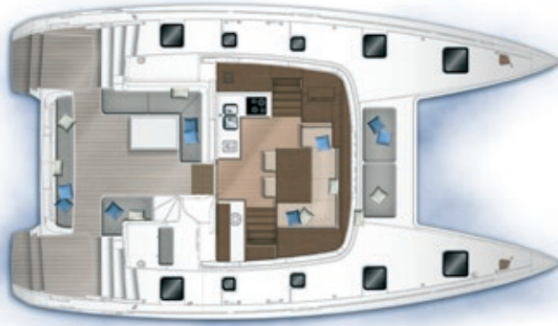
Carré et cockpit / Saloon and cockpit