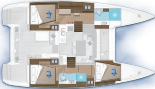
3 cabines, 2 salles d'eau / 3 cabins, 2 bathrooms