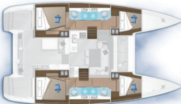
4 cabines, 4 salles d'eau / 4 cabins, 4 bathrooms