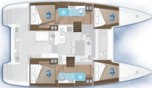
4 cabines, 2 salles d'eau / 4 cabins, 2 bathrooms